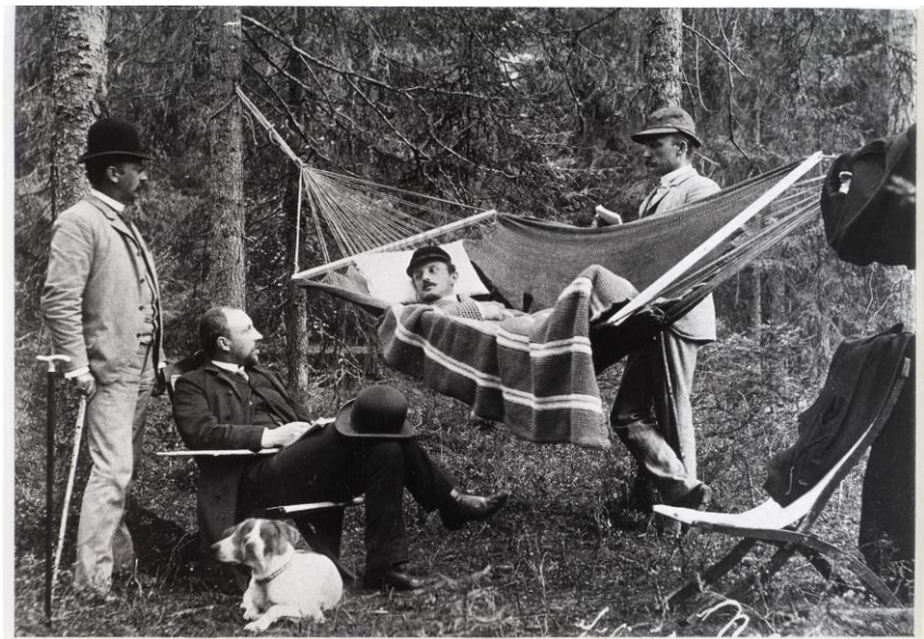
Prins Carl i hengekøya på Modum bad 1890 Fotograf: Ukjent Eier: Modum bad)