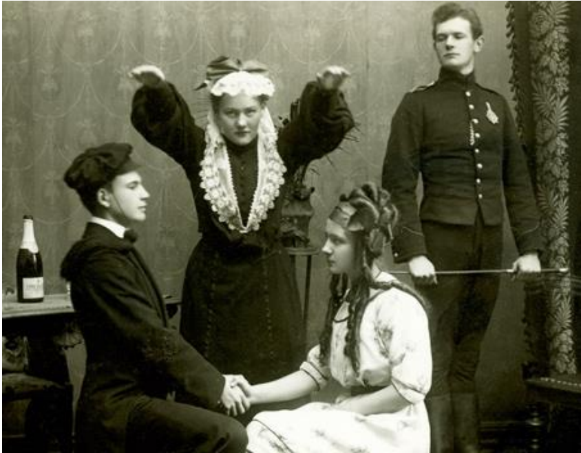
Teaterforestilling, «Kavallerichok», 1911