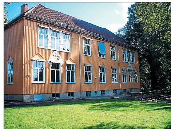
I dag holder en barnehage hus i det som en gang var Grefsen barne-sanatorium.