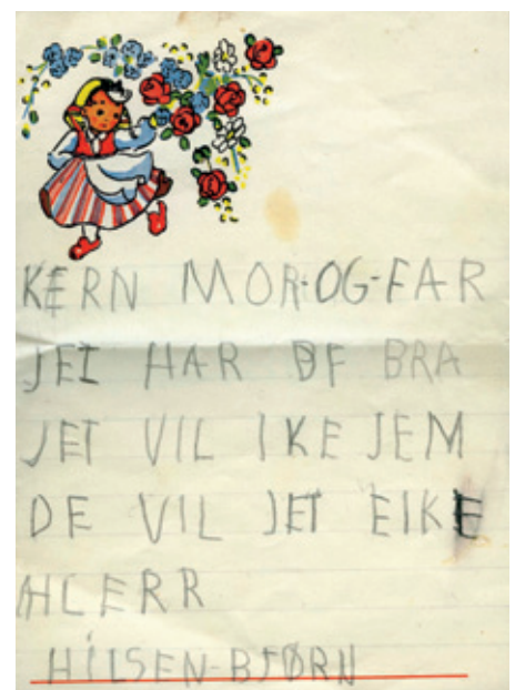
Andre brev til mor og far?