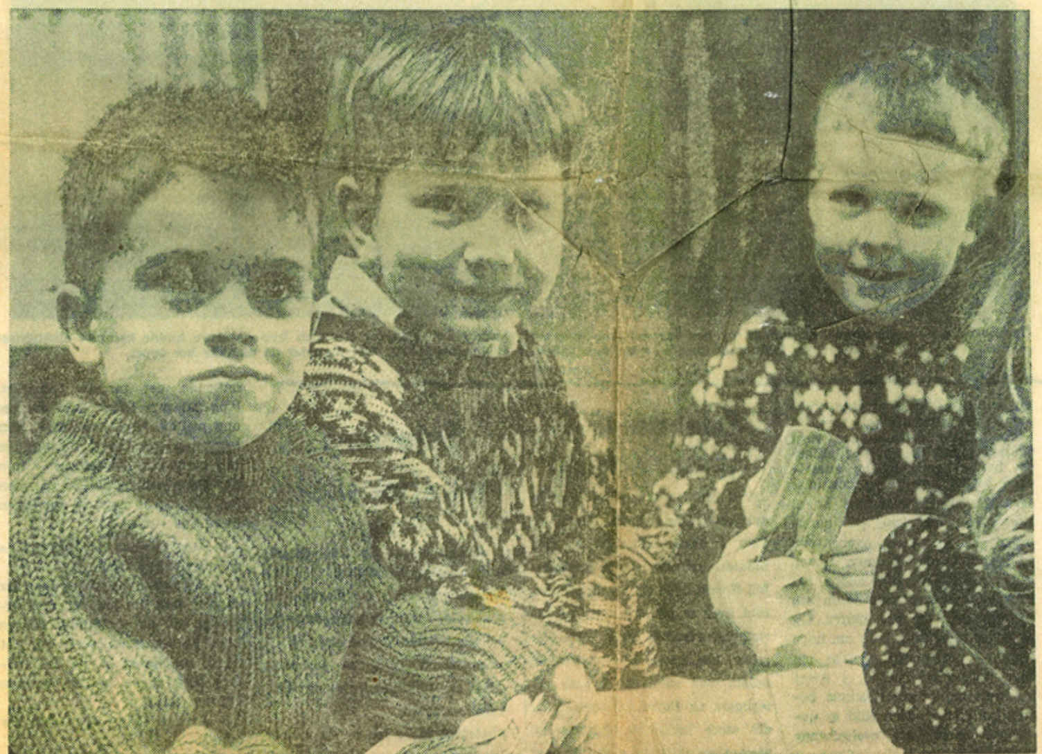
Disse tre kjekke karene synes igrunnen ikke at det å være på sanatorium er noen trafuff. Så er da også leketøyskisten velutstyrt og søstrene glade i å finne på ting om en ettermiddagstime skulle falle litt lang. Det gjør den sjelden, for en lekekamerat går det alltid an å finne. Det er for tiden 25 barn på barneavdelingen.