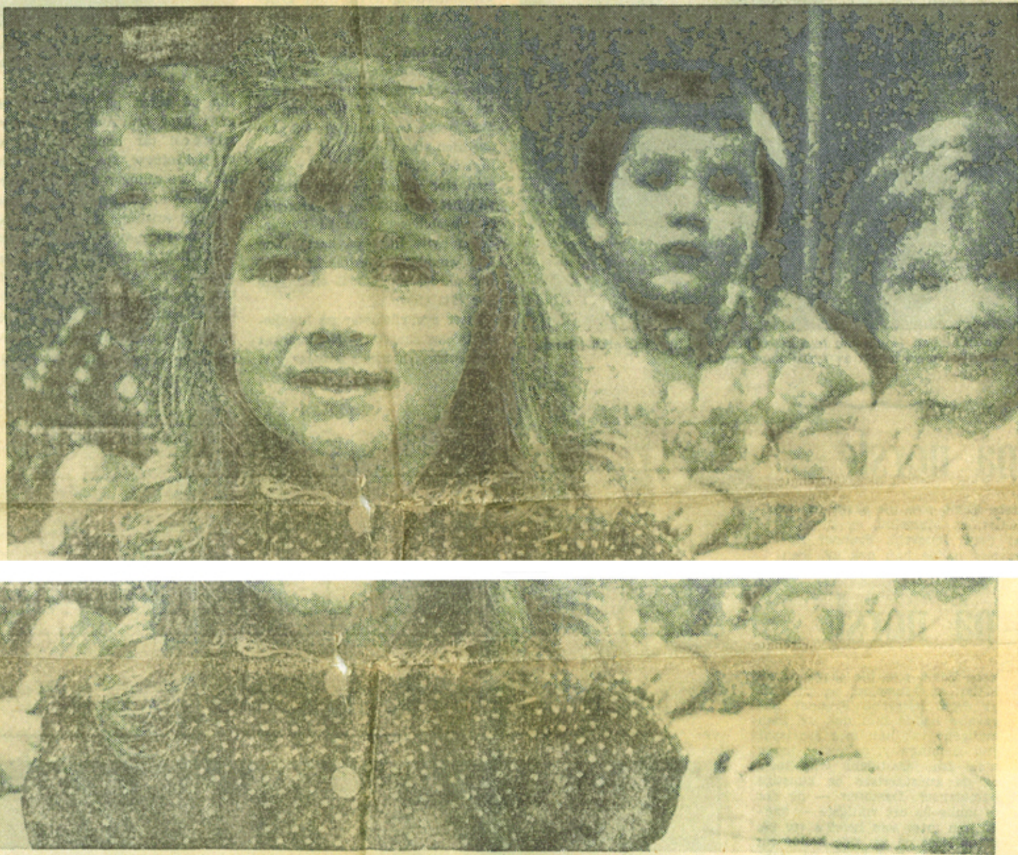
Femårige Tove med det lange, lyse håret, er en utmerket representant for de mange sjarmrollene på barneavdelingen. Hun har grunn til å se framtiden like tillitsfullt i møte med hun ser på fotografen, for ingen barn slipper ut av sanatoriet før de er garantert friske — og det for resten av livet.

imidlertid arbeidet med tilbakeføringen by på vanskeligheter, idet den avvikende del av klientellet relativt er så mye større nå enn før. Hele 45 prosent viste avvikende reaksjonstyper ved den undersøkelse kurator Olsen foretok, og de siste år er det bare tre-fire som har passet inn i attføringsinstituttet.