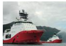
SØSKEN: Siem Ruby og Siem Topaz.

– Som den verftsgruppen som bygger mest lokalt, er robotisering og innovasjon viktig for å holde kostnadene nede, sier Rasmussen. TS