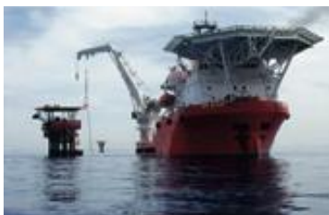
SERVICE: Nor Offshore har to konstruksjonsskip som operer i Asia og Australia.