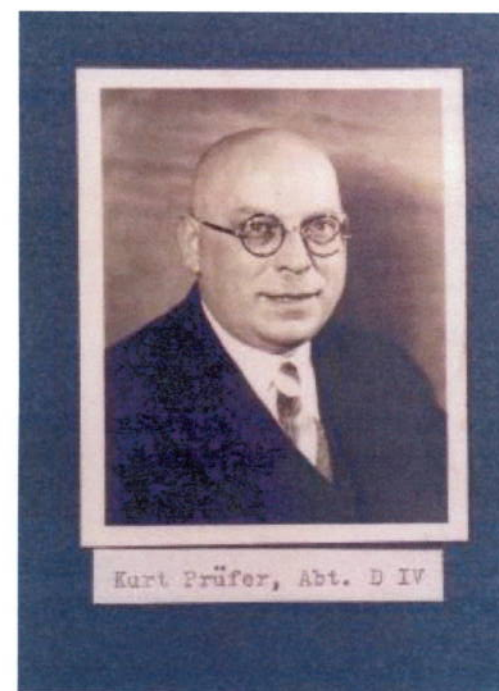
DØDSINGENIØREN: Kurt Prüfer ledet avdelingen som hadde ansvaret for gasskamrene og kremasjonsovnene i blant annet Auschwitz.