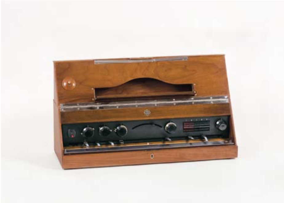
NTM 18199. Telefunken Volkstrautonium, 1933.