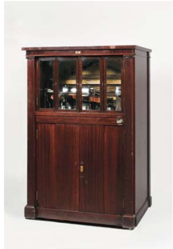
NTM 3859. Violano Virtuoso, ca. 1912.

The early Violano machines featured only a mechanical violin, but the machines that are known as Violano Virtuoso have both a violin and a piano. The violin in the machine has four strings, with a range of an octave on each string, and can reproduce 64 notes. All four strings can