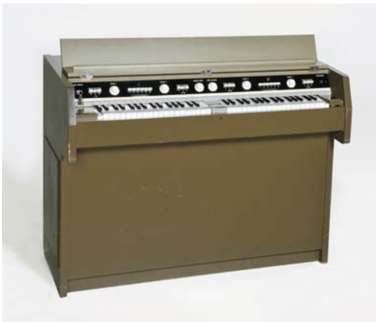
Mellotron FX Console, 1965-70. Utlånt av Rune Arnhoff.