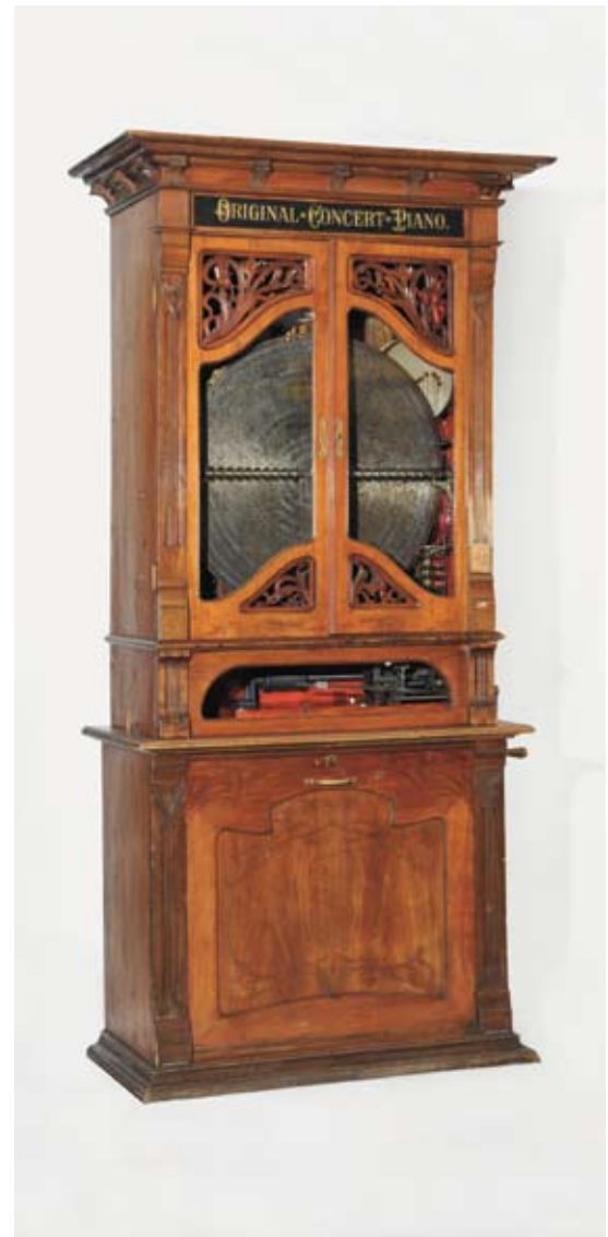
NTM7631. Lochmann musikkautomat, 1890-tallet.

The mechanism consisted of a piano, a large and a small drum, a cymbal and a glockenspiel. Unlike previous automatic musical instruments, which used cylinders, this one operated with perforated discs. This technique was developed and patented by Paul Lochmann in Leipzig in 1885, and rapidly became the most popular way of presenting mechanical music.