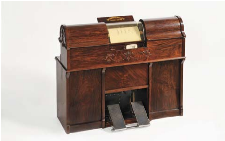
NTM 17939. Pianospiller, ca 1910.