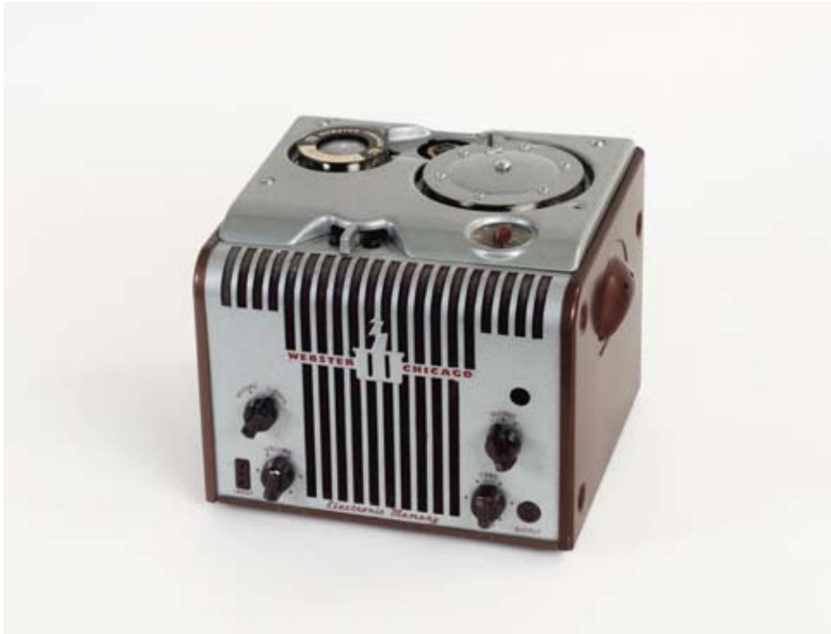
NTM 11049 Trådspiller, Webster Chicago Electronic Memory, ca. 1950.