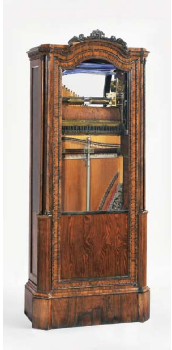
NTM7745. Chordaulodion, ca. 1840.

The chordaulodion has built-in pipeworks and piano. The music is stored on large wooden cylinders dotted with metal staples. The mechanism is driven by a weight placed on the back of the instrument. In the late 1800s large music machines were built which included the instruments of an entire marching band.