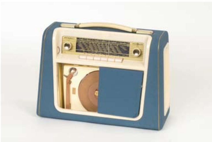
NTM 17210 Radionette Kurér Combi transistorradio med platespiller for 7" singleplater 45 rpm, 1960.