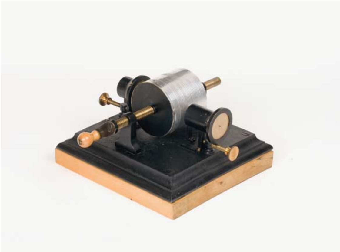
NTM 4515 Phonograph, model 1934.

and Technology. Norway's first sound recording, made in Tivoli, Oslo, in 1879, was thus preserved – but was unplayable.