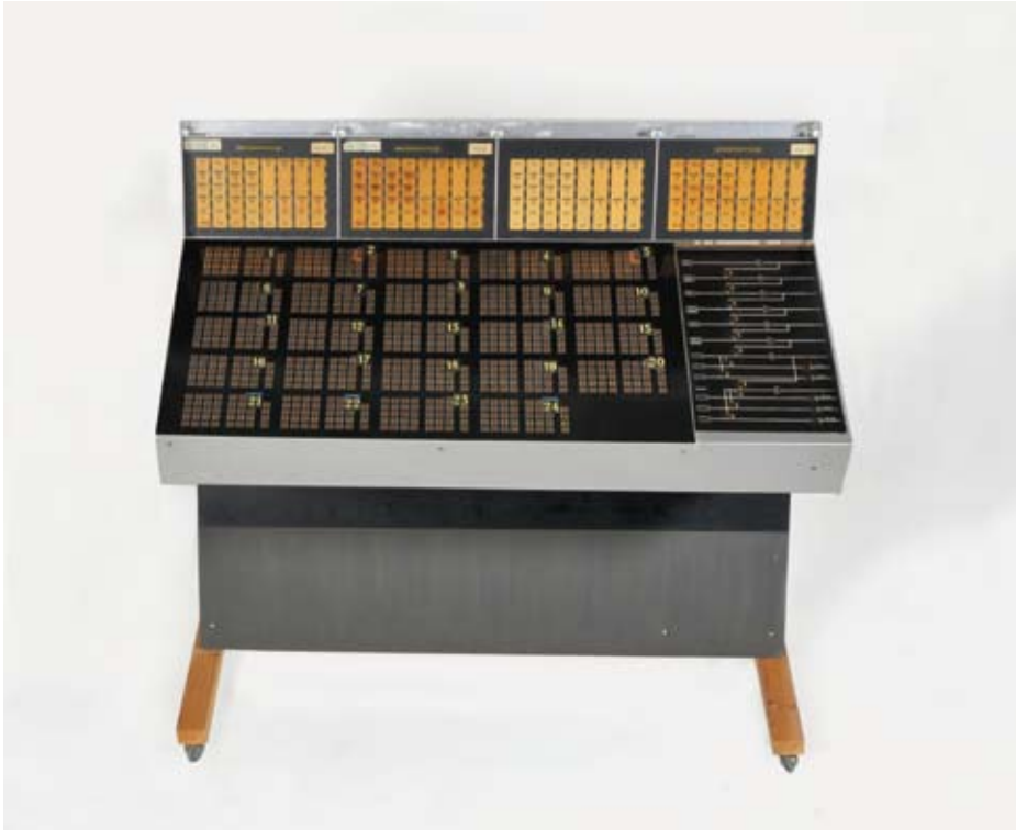
Studiopaneler, 1967. Utlånt av Musikmuseet, Stockholm.

Control panels, 1967. On loan from Musikmuseet, Stockholm.