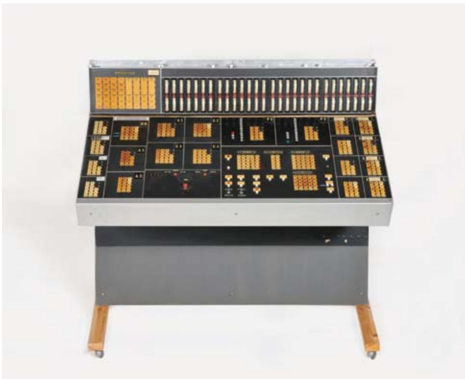
Studiopaneler, 1967. Utlånt av Musikmuseet, Stockholm.

Control panels, 1967. On loan from Musikmuseet, Stockholm.