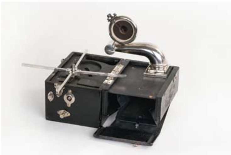
NTM 12552 Reisegrammofon, 1920-årene.