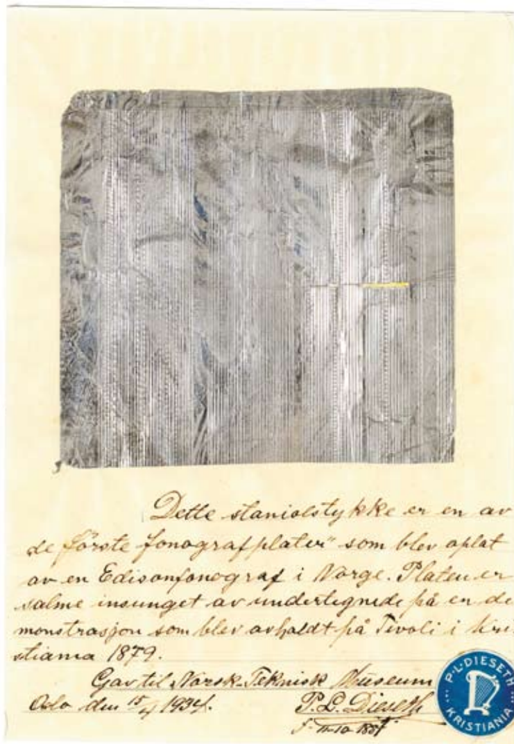
NTM 16500 Tinnfolieopptak, 1879.