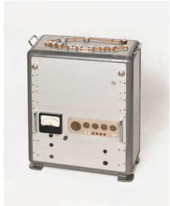
Båndekomaskin, 1957. Utlånt av Rune Arnhoff.

A tape echo unit has a short tape loop that travels across a series of sound heads. The aim was not only to produce an echo, but to produce a natural reverb effect. Arnhoff's constant improvements to the machine enabled him to increase the number of echoes indefinitely.