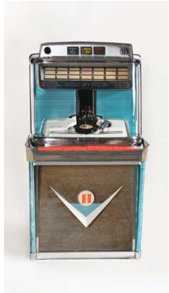
NTM 13878 Rock-Ola 1468 Tempo I jukeboks, 1959.

The jukebox acquired its name from the American slang for seedy dance joints. This says something about the status of mass-produced music machines as substitutes for live music. The status of the jukebox climbed with the rise of rock in the 1950s and 1960s, when recordings of the big stars became more important.