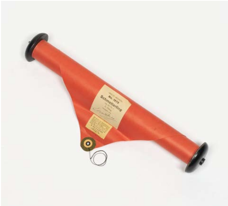
NTM 15205.33. Musikkroll, Edvard Grieg.