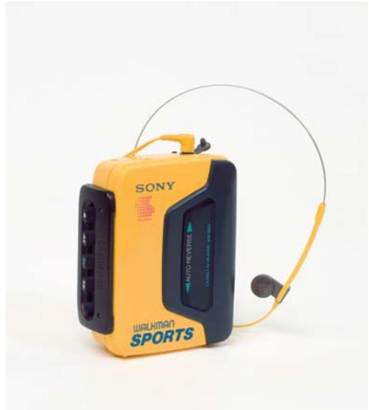
NTM 28061 Sony Sport Walkman, 1983.