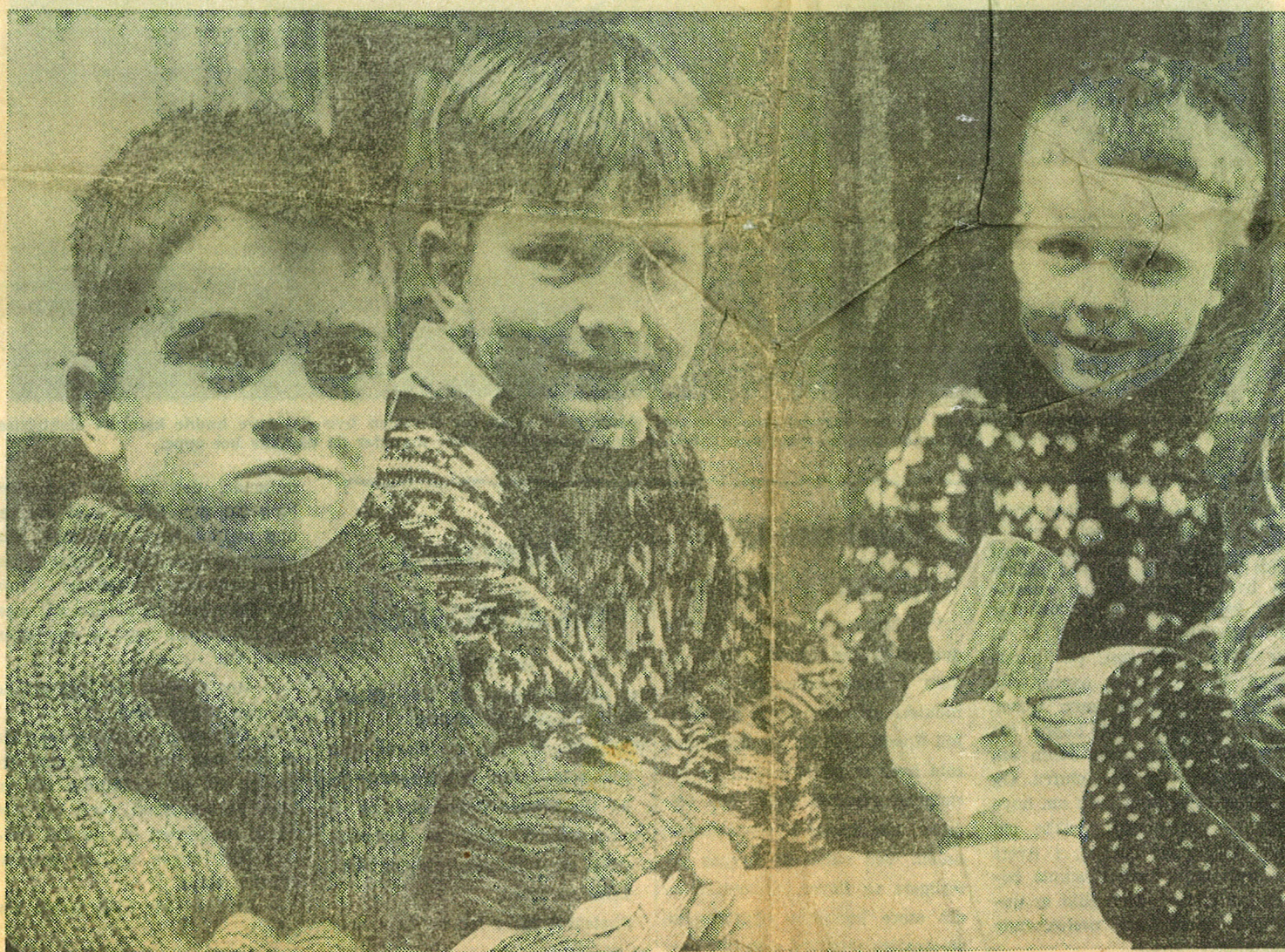
Disse tre kjeffe karene synes igrunnen ikke at det å være på sanatorium er noen straff. Så er da også leketøyskisten velutstyrt og søstrene glade i å finne på ting om en ettermiddagstime skulle falle litt lang. Det gjør den sjelden, for en lekekamerat går det alltid an å finne. Det er for tiden 25 barn på barneavdelingen.

rom å boire seg i. Ja, for lærdom må til. Forsøksplanen følges i den to-delte skolen, og på Sanatoriet er det blitt tatt både real-skoleeksamen og folkeskoleeksamen, ja til og med artium og forberedende prøve ved Universitetet. Det nytter ikke å slippe skolen selv om en er syk. Rekonvalesensen kan som sagt ta tid, og barna beholdes ekstra lenge. Til gjengjeld har de de beste utsikter til å bli friske og motstandsdyktige mot tuberkulose for resten av livet.